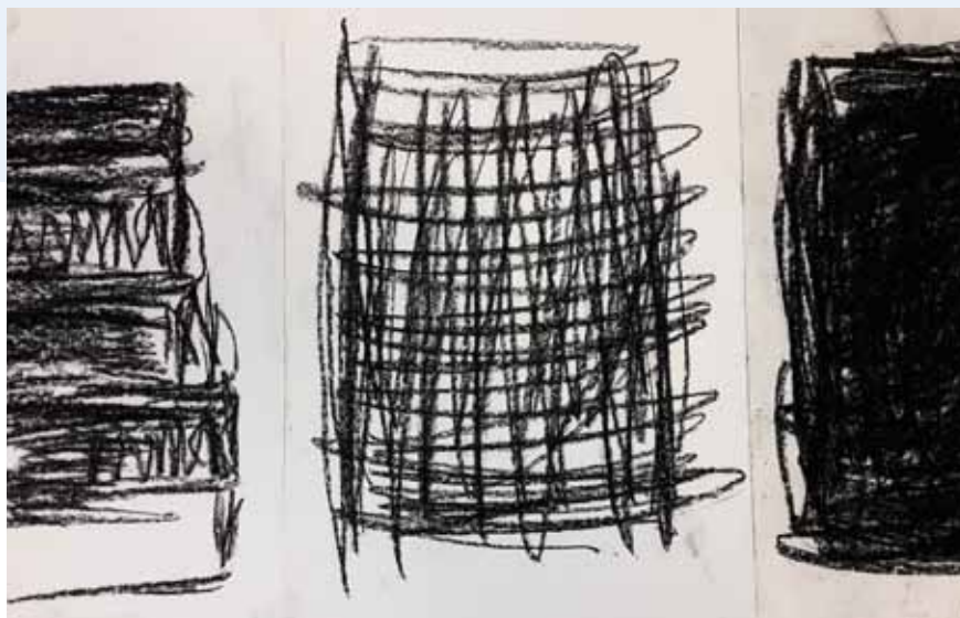
Afbeelding 1: Kinesthetische component, krasoefening.

Beeldend werken bevat bijna altijd (motorische) handelingen, maar op de kinesthetische component staat de fysieke activiteit op zichzelf centraal. Het is de meest basale vorm van expressie. Ervaringen op deze component zijn gericht op actie waarbij fysieke aspecten zoals ruimte, energieniveau, spierspanning maar ook ritme onderdeel (kunnen) zijn. Kinesthetische informatie speelt een belangrijke rol in non-verbale communicatie, in hoe het lichaam zich – al dan niet ritmisch – beweegt in de ruimte. Door in beeldende therapie in te spelen op de kinesthetische component kan worden gewerkt aan de toename of afname van arousal en spanning van de cliënt, en het bewust worden van en in contact zijn met lichaamssensaties (lichaamsmentaliteit). Een krasoefening met grafietstift kan bijvoorbeeld een cliënt helpen bewegingen te exploreren, door deze groter of kleiner, langzaam of juist snel of met zwaardere lijndruk te maken. Deze kinesthetische ervaring kan een innerlijk gevoel van bijvoorbeeld boosheid verbinden met de externe ervaring van snel en hard krassen, waardoor ontlading kan worden ervaren of lichaamssensaties bewuster kunnen worden beleefd (Hinz, 2009, 2015).