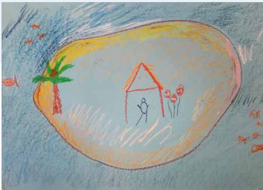
Afbeelding 5: Cognitieve component, eiland met krijt.

Een symbool impliceert een betekenis die onderliggend is aan wat concreet aanwezig of direct duidelijk is. Dit verschilt van een teken, dat een signaal of indicatie is waar direct iets uit voorkomt. Symbolen representeren of transformeren: zo kan een symbolisch beeld de brug vormen tussen het externe bestaan en de innerlijke betekenis (Hinz, 2009). Via een imaginatieoefening kunnen cliënten gestimuleerd worden om betekenisvolle innerlijke beelden uitdrukking te geven in materialen. Thema's kunnen op deze manier zichtbaar of tastbaar worden, wat inzichtge-