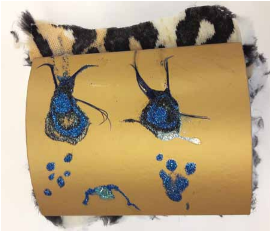
Afbeelding 4: Affectieve component, verdriet (troostdoos). (Foto Dimphy Fikke)

gebruiken van ruimte (bijvoorbeeld formaat papier) stimuleert volgens het ETC contact met emoties. Daarnaast wordt opgemerkt dat sensorische ervaringen toegang kunnen geven tot affectieve informatieverwerking, door bijvoorbeeld materiaal in te zetten dat irritatie, walging of juist ontspanning kan oproepen. Werkvormen kunnen concrete instructies bevatten zoals het verbeelden van de vijf basisemoties op plat vlak, of een specifieke emotie of stemming abstract vormgeven met lijn, kleur en vorm. Vragen naar de materiaalbeleving of het vormgevingsproces zijn volgens het ETC voorbeelden om (verbale) reflectie – wat nodig is voor het vergroten van het zelfbewustzijn – op de emotie te bevorderen. Ook kan geïntervenieerd worden op woordkeuzes van cliënten, die soms wijzen op het beschrijven van een mening of uitleg in plaats van hun beleefde gevoel. Voor cliënten die niet goed weten wat ze voelen, niet kunnen verbaliseren wat ze voelen of emoties onderdrukken, is het werken op de affectieve component geïndiceerd. Hierdoor is affectieve informatieverwerking bij veel en uiteenlopende problematiek relevant,