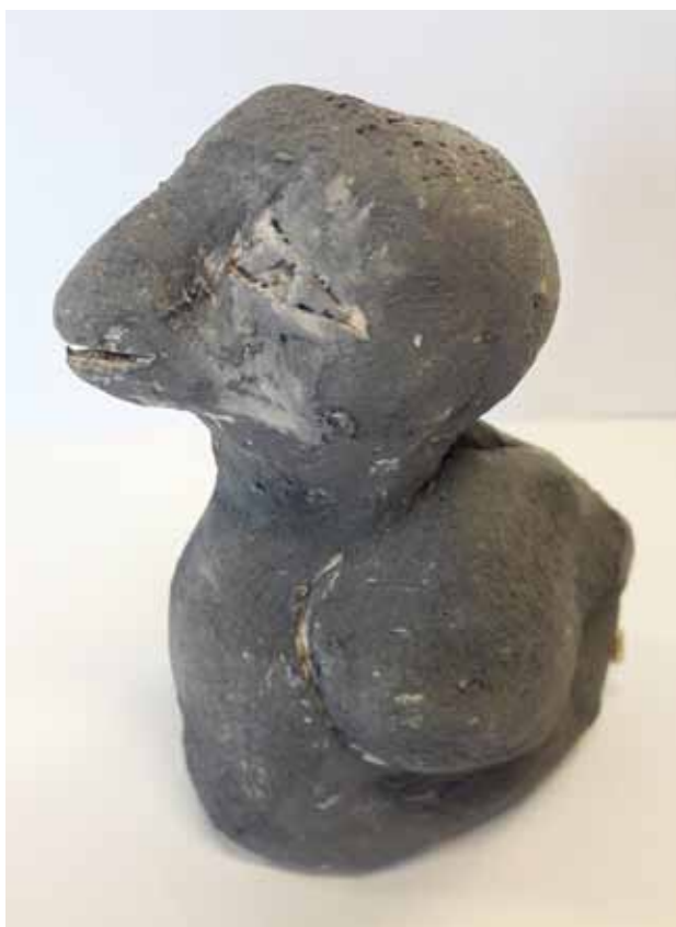
Afbeelding 6: Symbolische component, kleibeeld ('klein blijven').