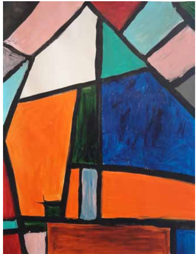
Afbeelding 3: Perceptuele component, compositie in vlakken.

de compositie: hoe verhouden de vormen zich tot elkaar, vertel eens wat over die lijnen, of welke verandering zou je willen aanbrengen?